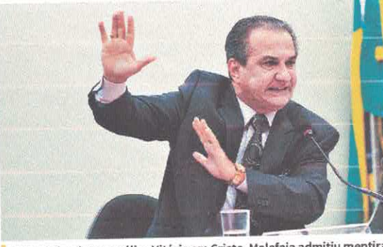
Líder da igreja evangélica Vitória em Cristo, Malafaia admitiu mentira

Dilma. Tem que ser honesto com isso aí. Ele já teve vínculo lá atrás com o PSOL, mas nunca assessorou Dilma em campanha. Estou aqui corrigindo porque eu fiz uma declaração na época e essa declaração, e olha que eu sou cuidadoso, de ver coisa em rede social e soltar. Mas na época, eu soltei, postei no Twitter fazendo a reconsideração, e agora to reconsiderando aí nesse vídeo. Tá certo? A verdade é a verdade", diz Malafaia em vídeo. As postagens contendo informações falsas, publicadas por Malafaia no ano passado, tiveram grande repercussão na eleição presidencial. Questionado pelo jornal GLOBO à época sobre a postagem, Malafaia