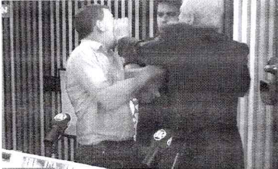
Momento em que Augusto Nunes mete a mão no rosto de Glenn no estúdio