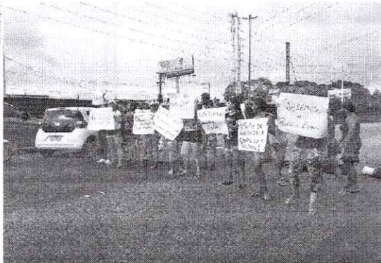
Protesto foi realizado à tarde. Manifestantes serão recebidos amanhã.

A Secretária Executiva de Mobilidade Urbana de Belém (Semob) informou que, na capital paraense, a circula-