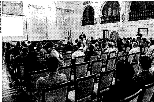
Lançamento fez parte da programação que comemora os 200 anos da ACP