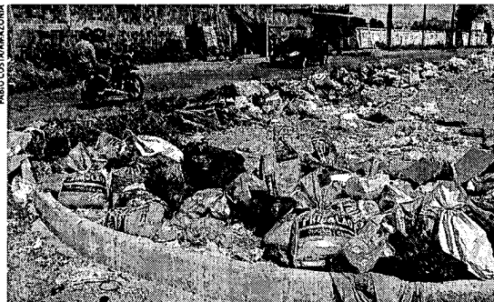
Lixão é formado irregularmente na rua, propiciando a proliferação de bichos

Qualquer lixão ou aterro sanitário, pela legislação, deve ficar a pelo menos 20 quilômetros de distância de qualquer aeroporto, justamente para evitar a proliferação de urubus e outras aves que possam colidir com as aeronaves. O Centro de Investigação e Prevenção de Acidentes Aeronáuticos (Cenipa) informa que dependendo do tamanho da ave, uma colisão pode causar estragos muito graves. Até mesmo derrubar um avião. Um urubu