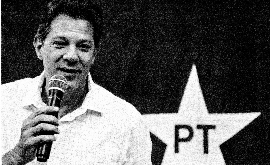
Haddad: "Parte do crime tem organizações nacionais e, para isso, a PF tem que entrar"

Durante toda a tarde, em um hotel em São Paulo, Haddad dedicou parte do tempo para tratar exclusivamente do tema. Integrantes da coordenação de campanha admitem que estão em discussão propostas de se-