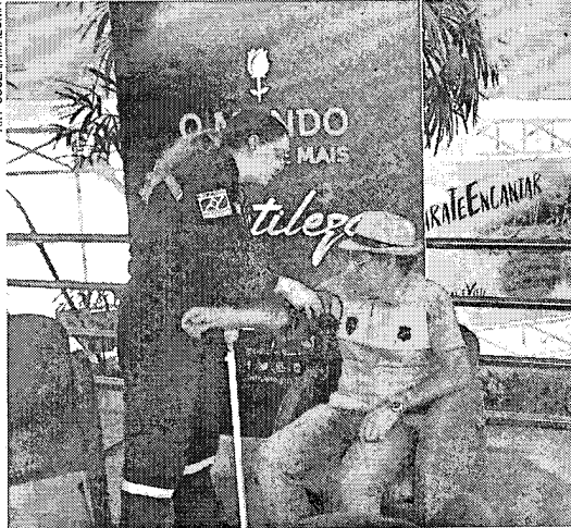
Verificação de pressão foi um dos serviços ofertados ontem no aeroporto